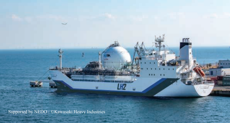
Supported by NEDO