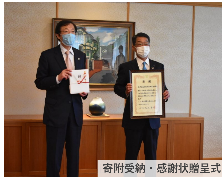
寄附受納・感謝状贈呈式