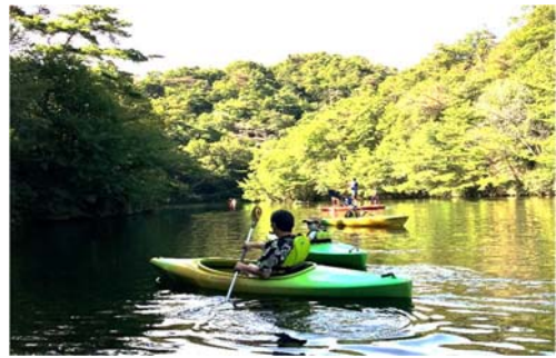
(湖面活用イメージ)