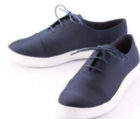
SDGs 関連商品 神戸シューズ・漁網スニーカー

また、神戸空港就航都市である青森県と連携し、双方の産業の強みを活かしたビジネスマッチングの開催や販路開拓を支援する。