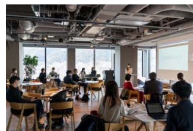
(マッチングプログラムイメージ)

市内企業の革新的な事業開発や課題解決に向けて、有用な技術等を持つ企業とのマッチングプログラムを実施する。あわせて、企業やクリエイターなどがオープンイノベーションを実践するコミュニティを運営し、新たなビジネスが自発的に生まれる環境を創出する。