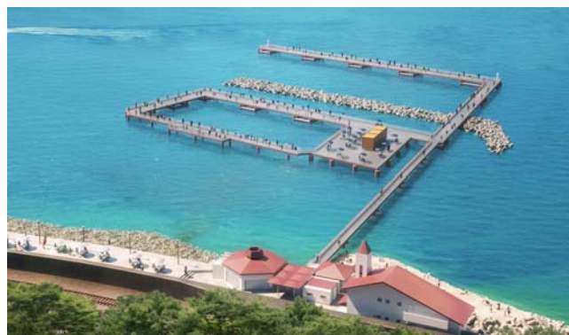
(須磨海づり公園イメージパース)

須磨海づり公園の再開に向けて、管理塔や釣台の一部を撤去するとともに、被災が少ない釣台の復旧および陸上施設の整備を行う。また、撤去部材を活用した漁礁の設置や藻場形成調査等、豊かな海づくりに取り組む。