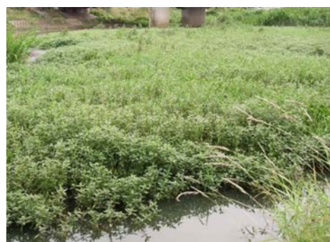
(ナガエツルノゲイトウ)