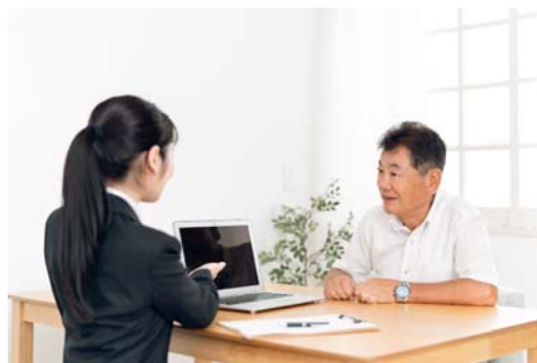
(キャリア相談のイメージ)