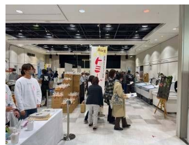
(R4 青森県内での展示会)