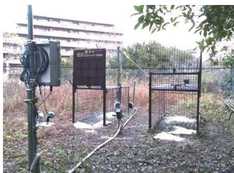
(遠隔操作できる捕獲わな)

また、ため池等でのナガエツルノゲイトウ（特定外来生物）による農業被害を防止するために、通報窓口の設置、専門家による同定及び防除支援などの体制を整備する。