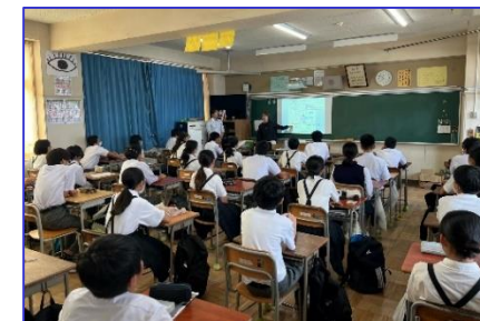
<学校での出前講座>