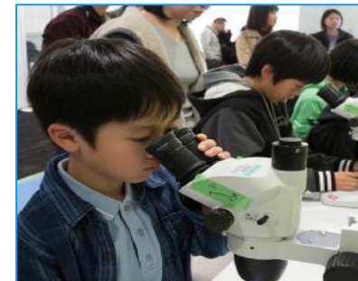
<観察体験(理化学研究所)>